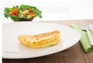
Omelet fijne kruiden