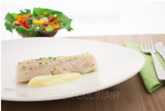
Tilapia filet gestoofd