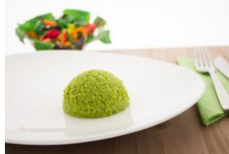
Aard.puree met erwten