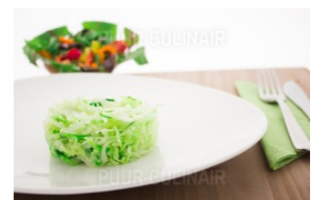
Spitskool + boter