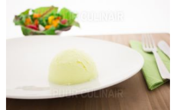
Aardappelpuree iddsi 4