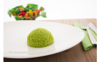
Aard.puree met erwten