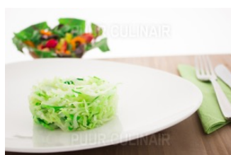
Spitskool + boter