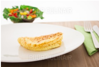
Omelet fijne kruiden