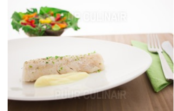
Tilapia filet gestoofd