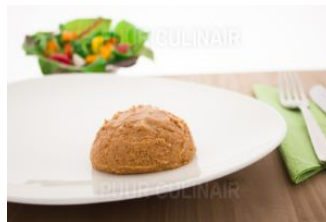
Bourgondisch Rundvlees Gm