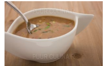
Held Thaise Kippensoep