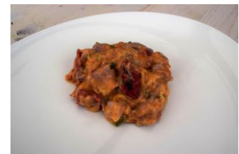
Pastasaus kip pesto