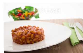
Witte bonen/ tomaat