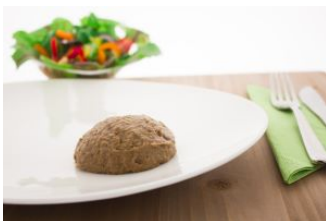
Indisch kippenvlees Gm